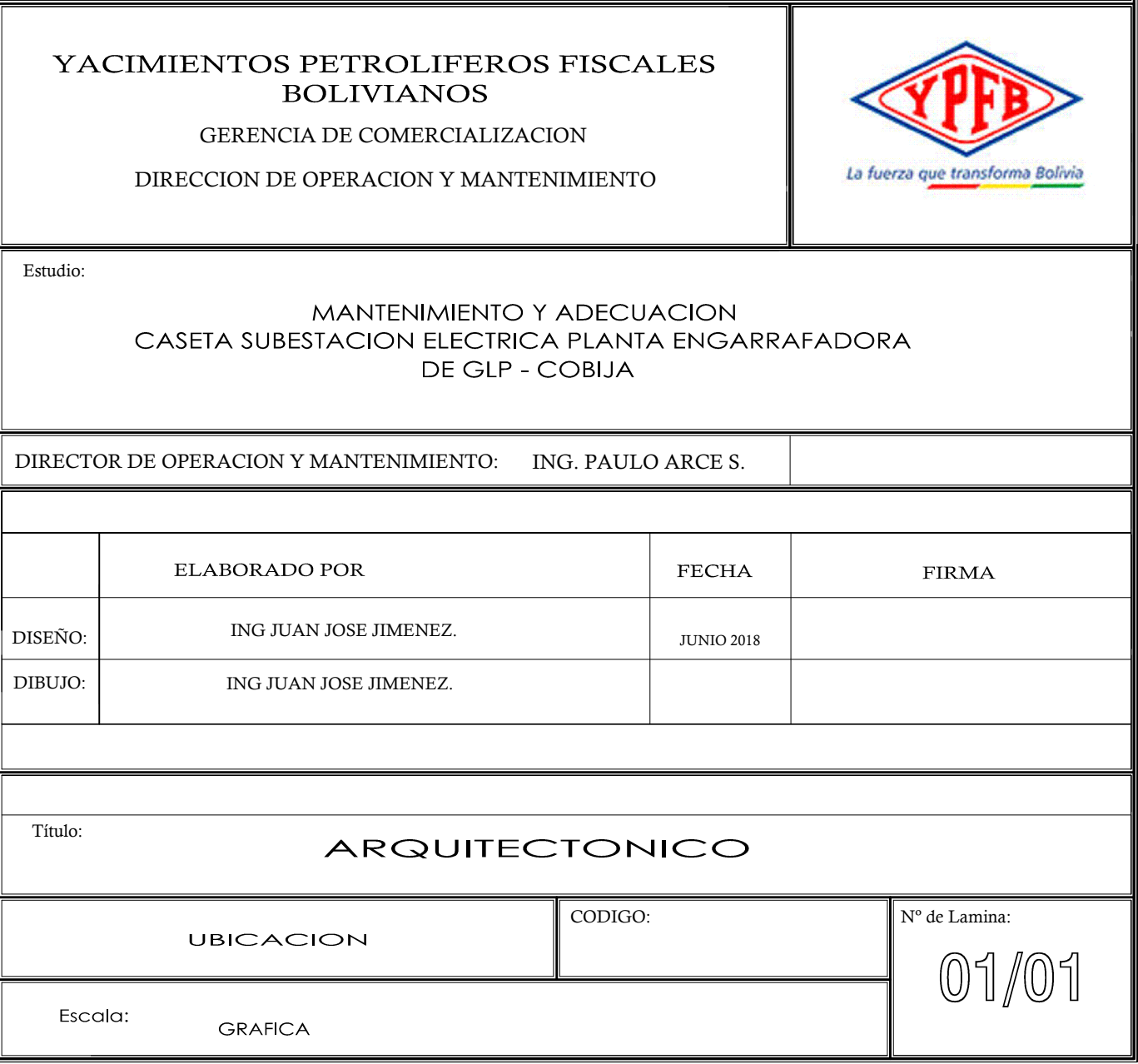
AREA DE CONSTRUCCION